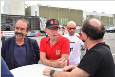
De nombreuses personnalités avaient fait le déplacement dont Philippe Martinez