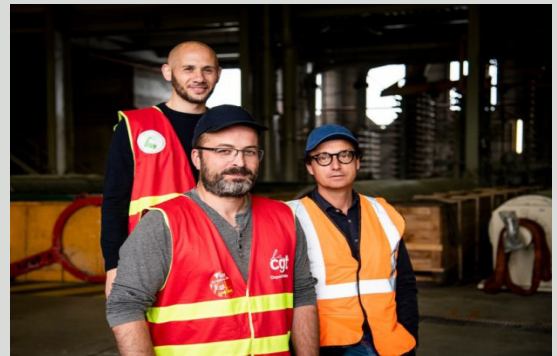
Les 3 compères qui n'ont jamais rien lâché