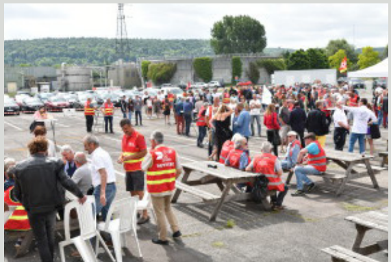
Amis et camarades se sont retrouvés dans la fraternité et la convivialité