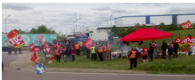
Villeroy bloqué les 20 et 21 mai

La CGT n'accompagnera pas la casse de l'entreprise et continuera de lutter, de rassembler les salariés, contre la politique mortifère de la direction.