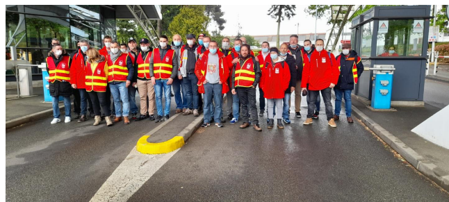
Délégation de Renault Cléon le 6 mai

La filière fonderies est durement impactée par cette volonté de délocaliser et de d'augmenter les profits, le patronat à la volonté de supprimer 5000 emplois, (40% des emplois dans les fonderies Françaises) et de restructurer toute la filière.