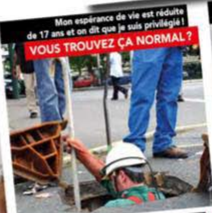
Mon espérance de vie est réduite de 17 ans et on dit que je suis privilégié! VOUS TROUVEZ ÇA NORMAL ?