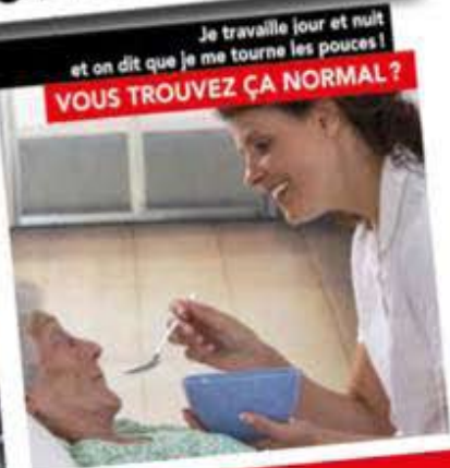
Je travaille jour et nuit et on dit que je me tourne les pouces! VOUS TROUVEZ ÇA NORMAL ?