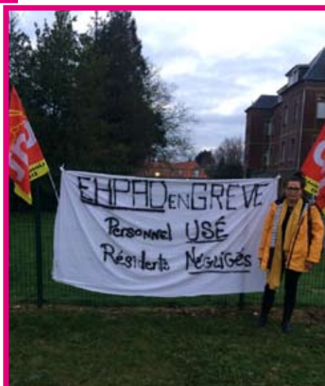
Ehpad de Dieppe