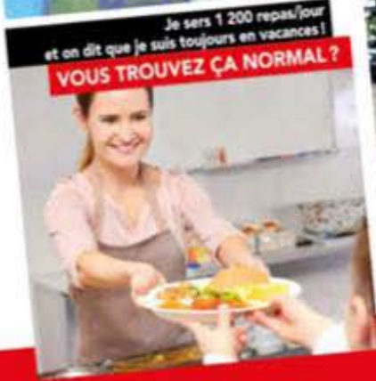
Je sers 1 200 repas/jour et on dit que je suis toujours en vacances! VOUS TROUVEZ ÇA NORMAL ?