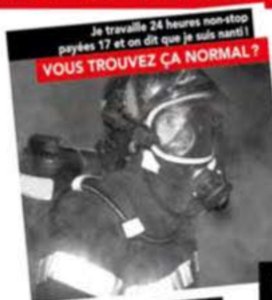
Je travaille 24 heures non-stop payées 17 et on dit que je suis nanti! VOUS TROUVEZ ÇA NORMAL ?