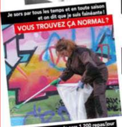
Je sors par tous les temps et en toute saison et on dit que je suis fainéant! VOUS TROUVEZ ÇA NORMAL ?