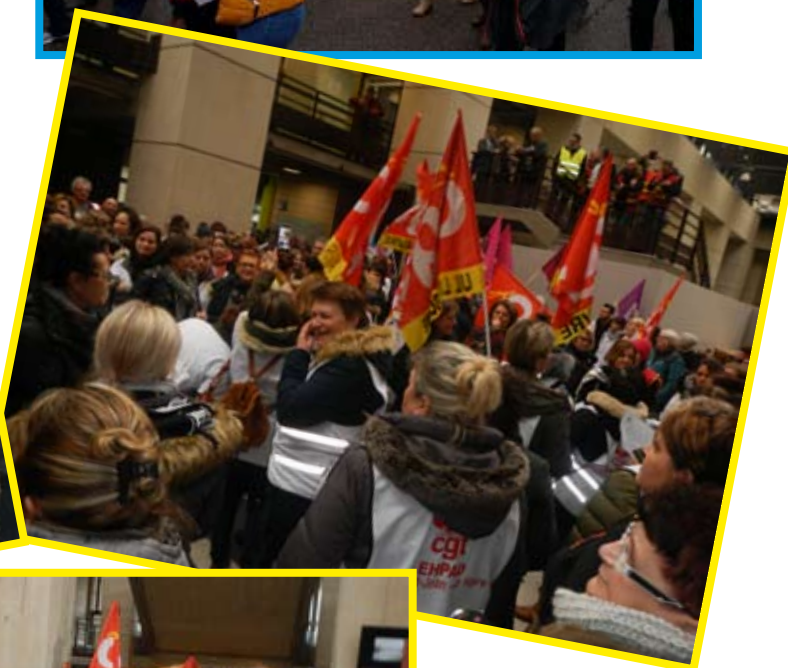
Forte mobilisation au Havre