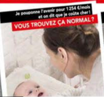
Je pouponne l'avenir pour 1254 €/mois et on dit que je coûte cher! VOUS TROUVEZ ÇA NORMAL ?