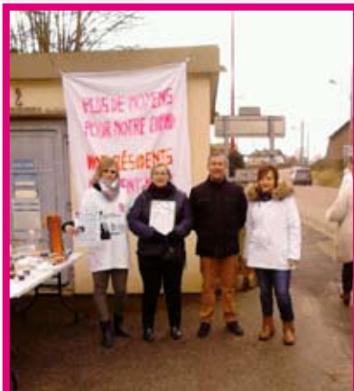
Ehpad Saint Crespin