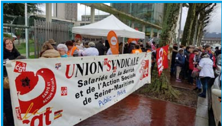
Plus de 500 à Rouen