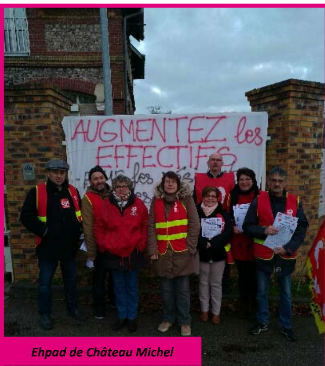
Ehpad de Château Michel