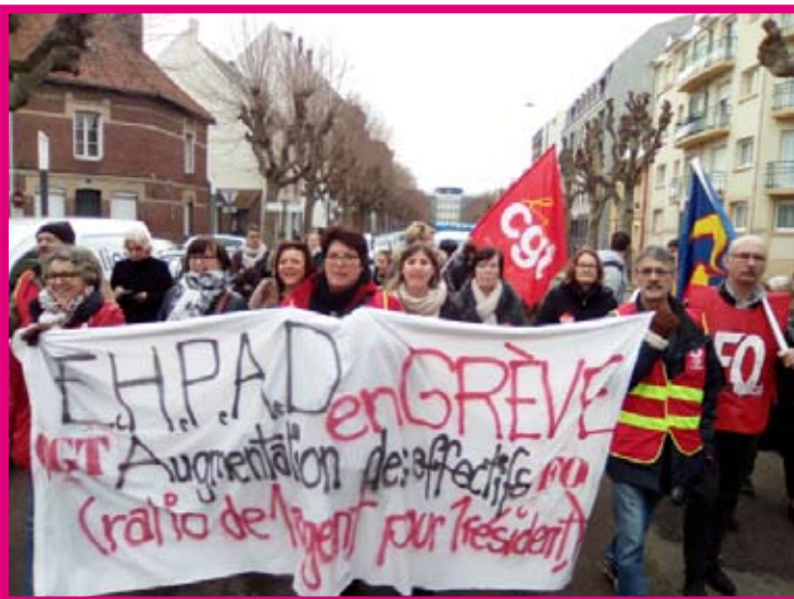
Près de 250 dans le cortège de Dieppe