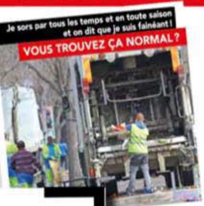
Je sors par tous les temps et en toute saison et on dit que je suis fainéant! VOUS TROUVEZ ÇA NORMAL ?